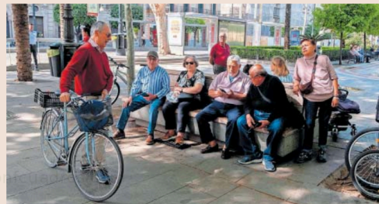
Varias personas tras una protesta por las pensiones en Sevilla. PACO PUEENTES

Para medir la ignorancia de los españoles sobre las pensiones, se han realizado dos preguntas a los encuestados, que solo un 20% de la población consultada ha respondido correctamente en ambos casos; y el 51% da