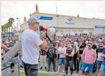
Los trabajadores se reúnen a las puertas de la factoría de Navantia en Cádiz, ayer.

Tras el anuncio, el plan a seguir era que se sometiese a votación en los principales centros de trabajo del sector de la provincia, con entorno a 30.000 trabajadores, a lo largo de la jornada del lunes. Pero ahí todo se torció. A lo largo de la jornada, UGT no llegó a precisar el resultado de esas asambleas y el preacuerdo no ha llegado a ser ratificado oficialmente por el sindicato en su asamblea de delegados.